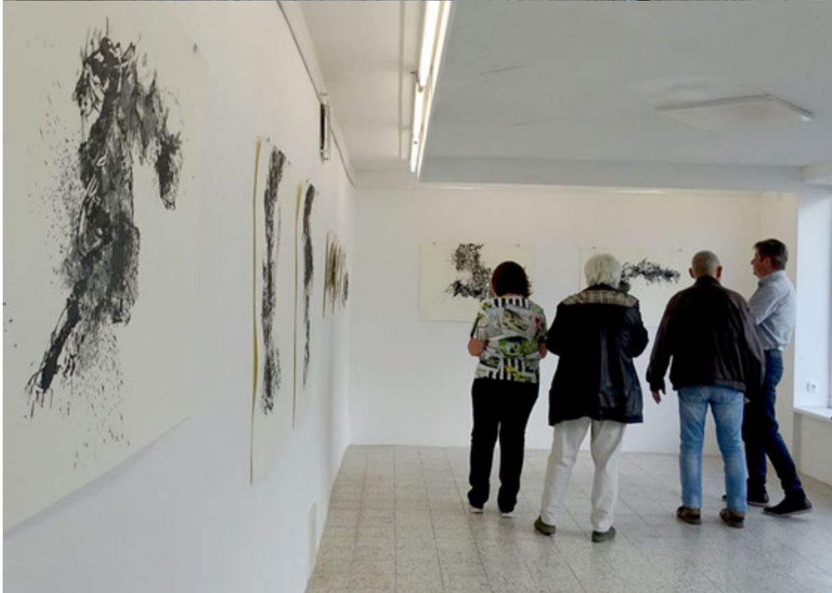
Werner Ryschawys „Spannungsfelder“ boten Interpretationsstoff bei den Besuchern im Nordhalbener „Maxhaus“.